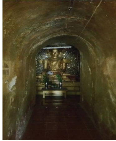
တောပုဘုရားအတွင်းရှိ ဂူဘုရား