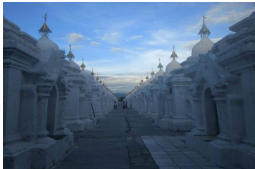
ယခုမဟာလောကမာရဇိန်(ကုသိုလ်တော်)ဘုရား ပိဋကတ်သုံးပုံကျောက်စာတိုက်များ