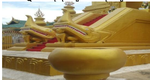
ယခုမဟာလောကမာရဇိန်(ကုသိုလ်တော်) ဘုရားရှိ သင်ပုတ်ဆွမ်းကပ်လှူသည့် သပိတ်တော်