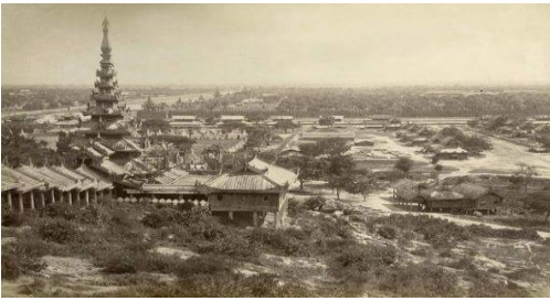
ယခင်မန္တလေးတောင်တော်