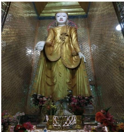
ဗျာဒိတ်ပေးဘုရား