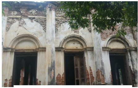
တောပုဘုရားရှိ ရုပ်စုံကျောင်း