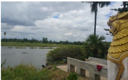
တောပုဘုရားအရှေ့ဘက်ရှိ မြစ်တိမ်(ခ)မြစ်တိမ်း ယခု နတ်ပေါက်ချောင်း