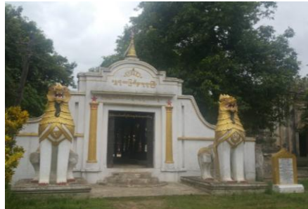
တောပုဘုရား(သို့)ရွှေဘုံသာ မြတ်စွာဘုရားကြီး