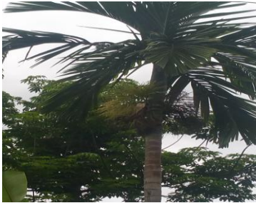
လက်ဆောင်ပေးသည့် ကွမ်းသီးပန်း