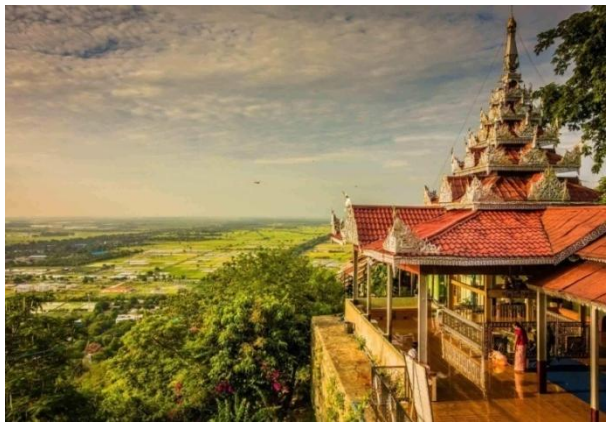
မဟာနန္ဒာကန်တော်တည်ရှိသည့်အရပ်