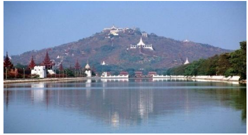
ယခုမန္တလေးတောင်တော်