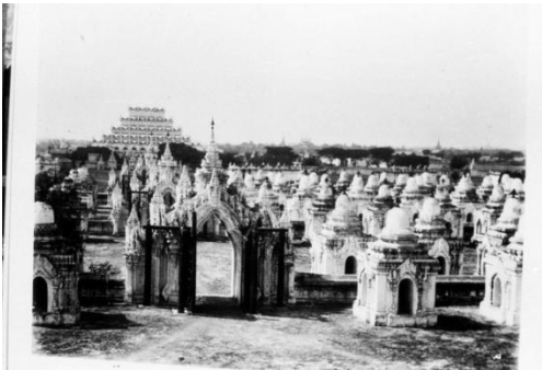
ယခင်မဟာလောကမာရဇိန်(ကုသိုလ်တော်)ဘုရား ပိဋကတ်သုံးပုံကျောက်စာတိုက်များ