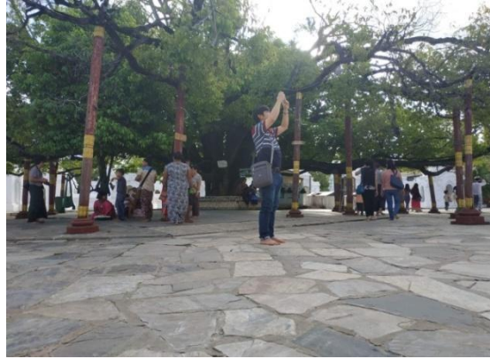
မဟာလောကမာရဇိန်(ကုသိုလ်တော်)ဘုရားရင်ပြင်ရှိ တလင်းပြင်