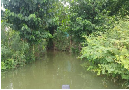
တောပုရွာ မြင်ကွင်း