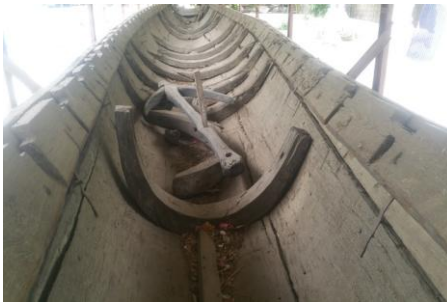
ကုန်းဘောင်ခေတ်ကအသုံးပြုခဲ့သည့် လောင်းလှေ