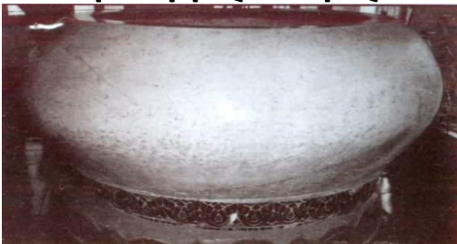
ယခင်မဟာလောကမာရဇိန်(ကုသိုလ်တော်) ဘုရားရှိ သင်ပုတ်ဆွမ်းကပ်လှူသည့် သပိတ်တော်