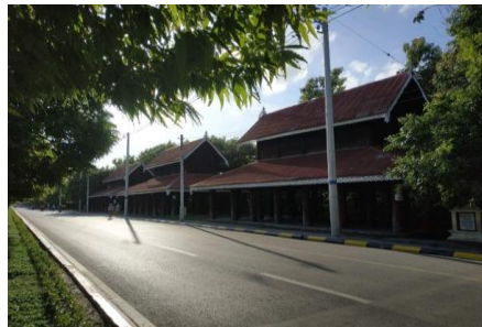
ယခုသုဓမ္မာရေပိတန်း