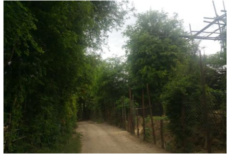
တောပုရွာ မြင်ကွင်း