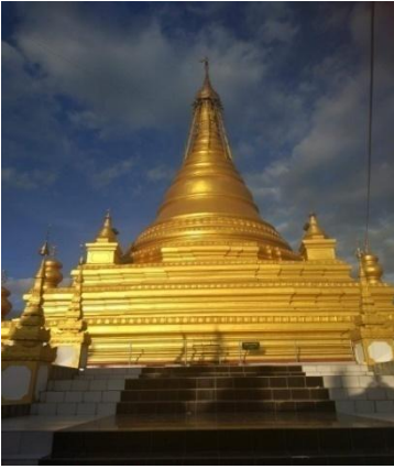
မဟာလောကမာရဇိန်(ကုသိုလ်တော်)ဘုရား