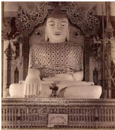
ယခင် ကျောက်တော်ကြီးဘုရား