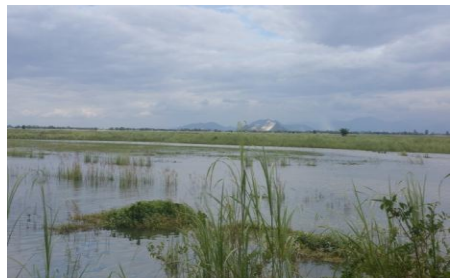
တောပုဘုရားပတ်ဝန်းကျင်ရှိ ရှုခင်းများ