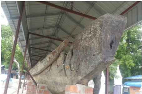
ကုန်းဘောင်ခေတ်ကအသုံးပြုခဲ့သည့် လောင်းလှေ