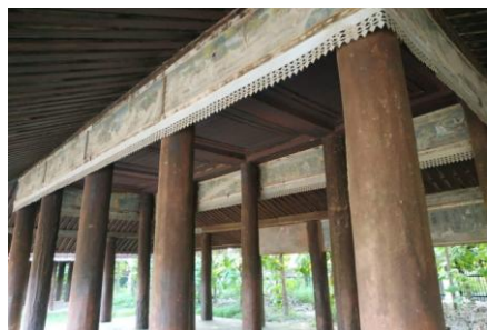
သုဓမ္မာရေပိတံ နံရံဆေးရေးပန်းချီများ