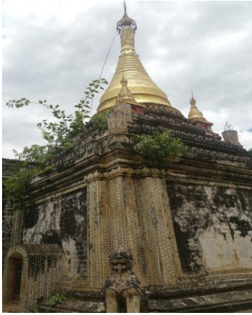
မတ္တရာမြို့အနောက်မြောက်ဘက်ရှိတောပုဘုရား