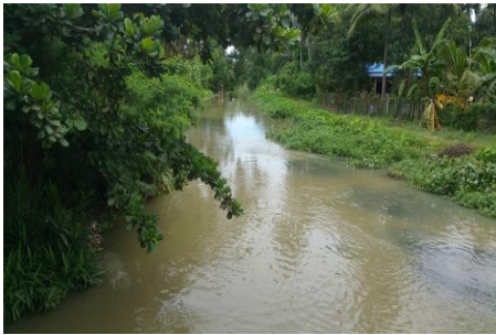
မတ္တရာမြို့ရှိ ယခု ရွှေတချောင်းမြောင်း