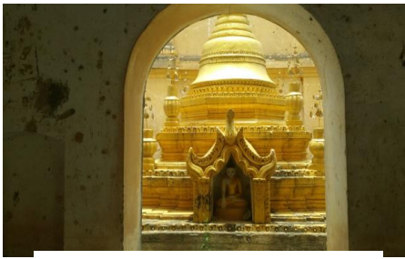
တောပုဘုရားဘေးရှိ အရံစေတီ