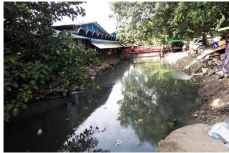
မန္တလေးမြို့ရှိ ယခု ရွှေတချောင်းမြောင်း