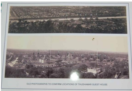
ယခင်သုဓမ္မာရေပိတန်း